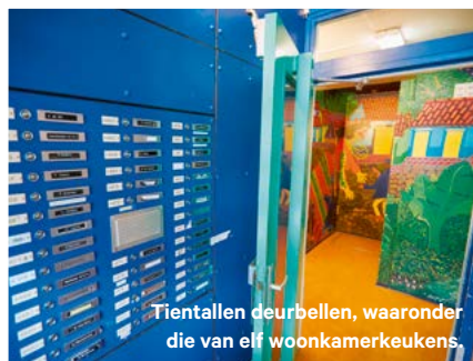
Tientallen deurbellen, waaronder die van elf woonkamerkeukens.