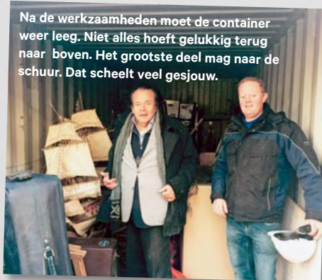
Na de werkzaamheden moet de container weer leeg. Niet alles hoeft gelukkig terug naar boven. Het grootste deel mag naar de schuur. Dat scheelt veel gesjouw.

geeft advies over de inrichting van de woonkamer. Ze stelt voor de bank tegen de muur te zetten in plaats van middenin de woonkamer, zoals eerst. Het oogt nu veel groter.