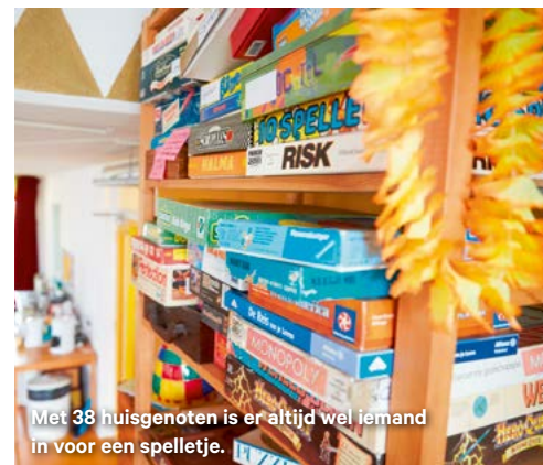
Met 38 huisgenoten is er altijd wel iemand in voor een spelletje.