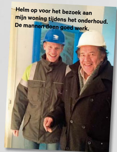
Helm op voor het bezoek aan mijn woning tijdens het onderhoud. De mannen doen goed werk.

Bij hoge uitzondering mag ik in mijn woning kijken terwijl de mannen aan het werk zijn. De nieuwe keuken zit er al in en ze zijn aan het werk in de badkamer. Alle oude rommel is eruit en het wordt allemaal mooi wit en schoon. Ze werken snel en netjes. Wat je noemt de juiste mensen op de juiste plaats.