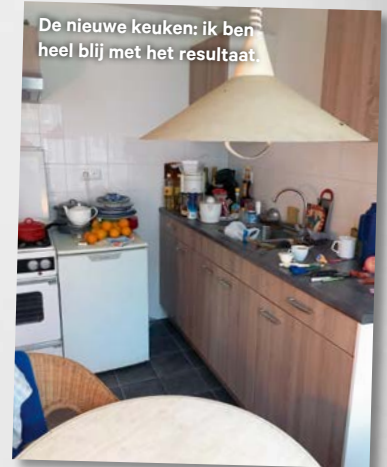
De nieuwe keuken: ik ben heel blij met het resultaat.

De container is nu helemaal leeg. Alle dozen met schepen en boeken staan beneden en in de schuur. De boeken moeten in de kast in mijn woonkamer, dat ga ik de komende weken doen.