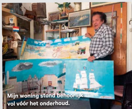
Mijn woning stond behoorlijk vol vóór het onderhoud.