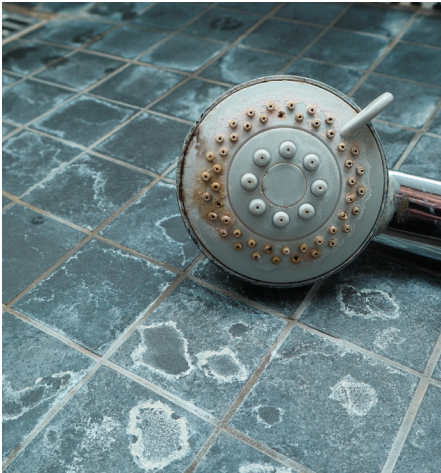
Viezigheid en kalkaanslag