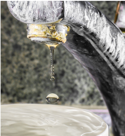
Viezigheid en kalkaanslag