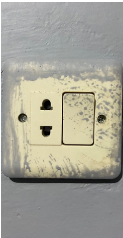
Verf op de wandcontactdoos