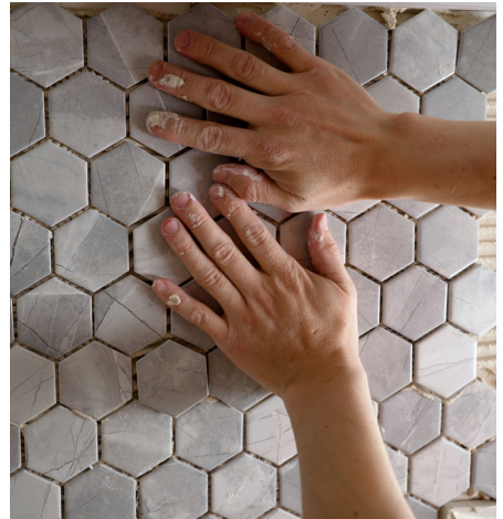
Tegels alleen met toestemming van Bo-Ex