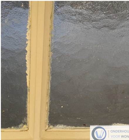
Verf op het glas