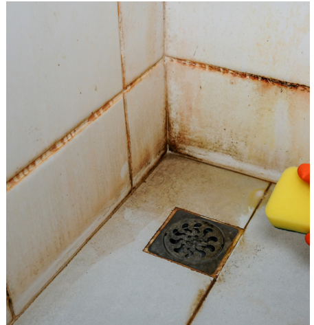
Schimmel op kitwerk en voegen