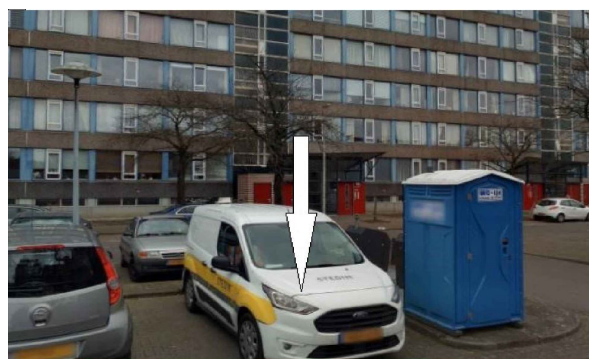
Locatie van de toekomstige container

De gemeente Utrecht heeft u een brief gestuurd met informatie over ondergrondse afvalcontainers. Binnenkort zal namelijk het verzamelen van huishoudelijk afval aan de Hanoidreef voor u veranderen. De inbandige afvalcontainers bij de algemene ingang verdwijnen. Zo zal de bekende overlast daarvan ook verdwijnen. U kunt uw huishoudelijk afval voortaan storten in de nieuwe ondergrondse perscontainer. De plek van de nieuwe ondergrondse perscontainer ziet u op de foto: dit is op de parkeerplaats naast de twee ondergrondse containers die er al zijn.