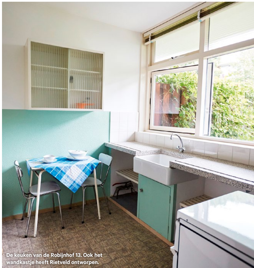
De keuken van de Robijnhof 13. Ook het wandkastje heeft Rietveld ontworpen.

Vredeburg, boven bioscoop Vreeburg. Toen zijn vrouw overleed, vertrok hij met zijn kinderen. Van hem mocht ik er toen een tijd wonen met mijn gezin. Alle meubels stonden er nog. Ook de meubels die hij zelf had ontworpen en die wereldwijd in allerlei musea tentoongesteld stonden. Hij zei: 'Wat je kunt gebruiken, gebruik je maar. De rest donder je maar weg.' Dat hebben we natuurlijk niet gedaan. Maar het zegt alles over Rietveld: hij hechtte totaal niet aan spullen."