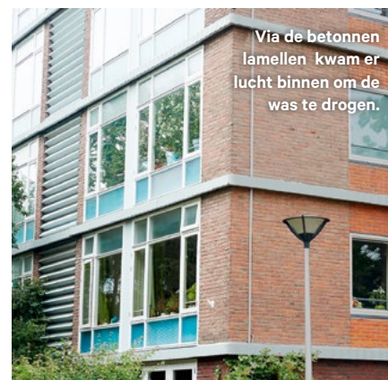
Via de betonnen lamellen kwam er lucht binnen om de was te drogen.