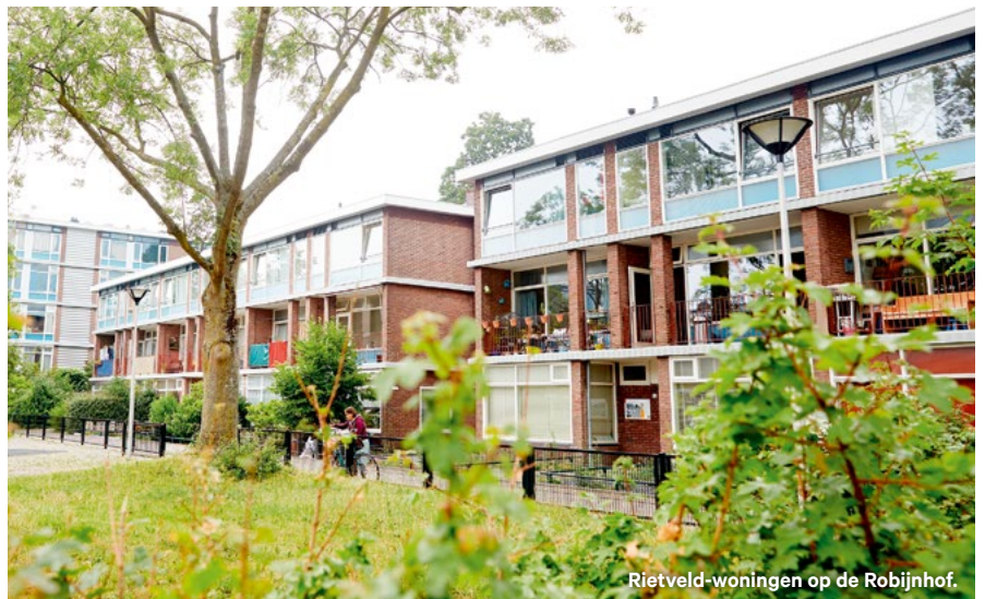
Rietveld-woningen op de Robijnhof.

"Rietveld was een genie, een ruimtekunstenaar"