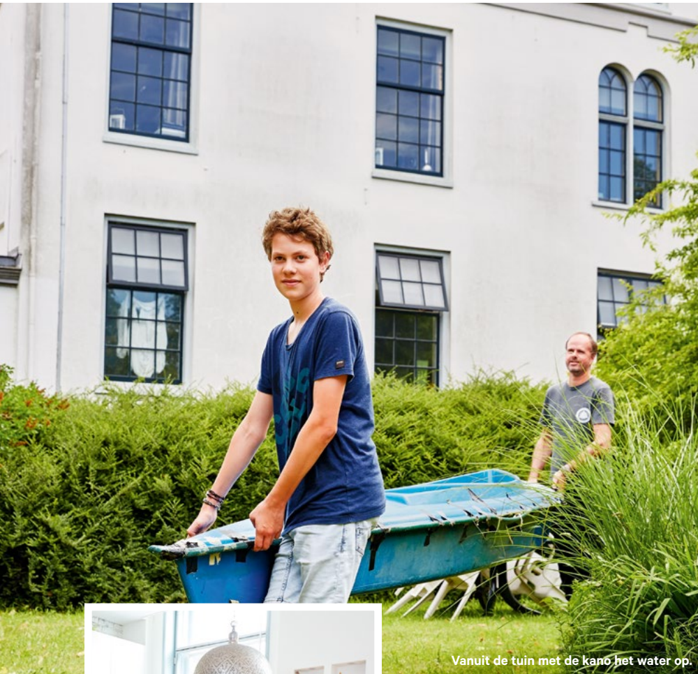
Vanuit de tuin met de kano het water op.